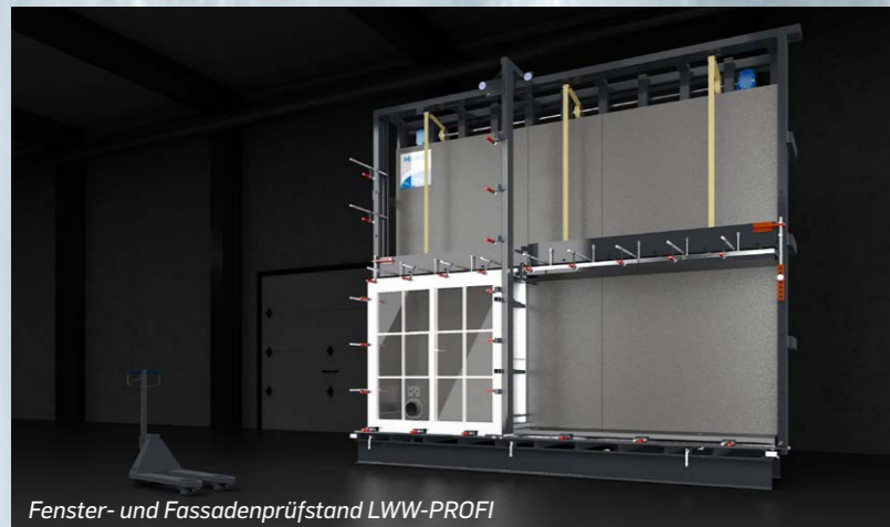
Fenster- und Fassadenprüfstand LWW-PROFI